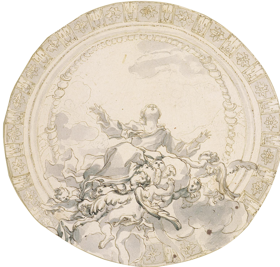
Gregorio dei FERRARI (Gênes, 1647-1726) Assomption de la Vierge - Plume, encre brune et lavis gris - 22 cm de diam.