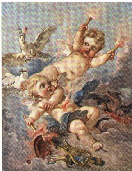
François Boucher, Deux amours , huile sur toile, Galerie Artesepia, Paris.

Voir « Objets extraordinaires, le Printemps des découvertes », Carré Rive Gauche, rues de Verneuil, de l'Université, de Lille, du Bac, des Saints-Pères... Paris VII e , www.carrerivegauche.com du 18 au 21 mai.