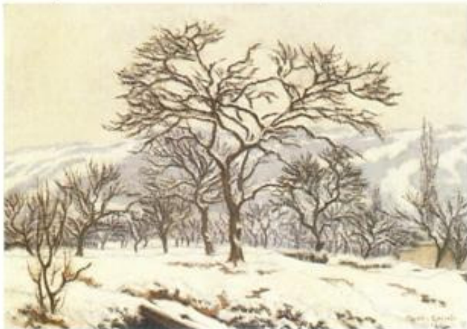
Charles Lacoste. « Paysage de neige ». HST. Galerie Mercier.