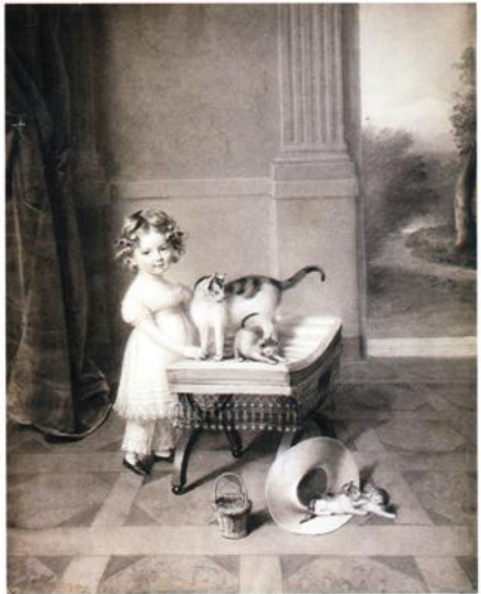
Ecole française. « Petite fille avec une chatte et ses chatons ». Craie et fusain. Galerie Fischer.

Un but, un lieu qui se décline en rendant visite aux galeries d'exposition qui pour un temps se sont muées en sources jaillissantes et pures, réunissant autant de chantres entièrement dévoués à l'art, et à ses charmes, et nourris par le seul critère de l'élégance du trait et des formes. Ainsi les rues, de Beaune, de Lille, de l'Université et de Verneuil se transforment-elles toutes en autant de petits, mais précieux musées. Avec autant de centres divergents mais toute spéciale dans lesquels se découvriront les arts picturaux. Que ceux-ci soient muraux ou de salon. L'exercice retenu ici étant l'inhabituel, nourri par le charme. Egalement les visiteurs remarqueront un autre